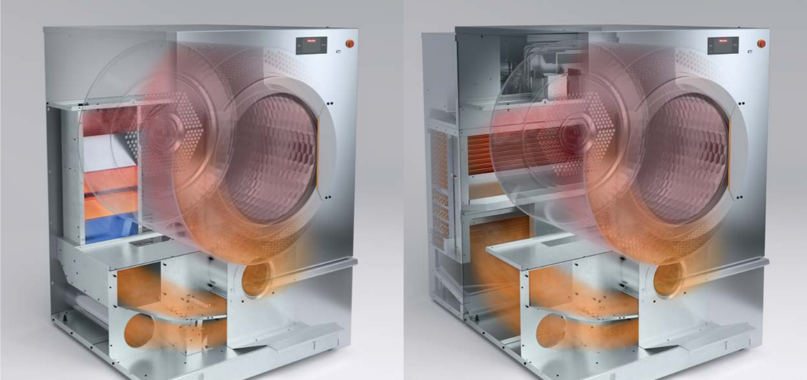
Función AirRecycling Flex

Las nuevas secadoras Benchmark logran tiempos de secado cercanos al límite físico y todo ello con una protección textil inmejorable. El motor de corriente continua de bajo desgaste garantiza un arranque suave y un giro muy uniforme del tambor, mientras que la rueda del ventilador de nuevo diseño resulta muy estable a la presión. En el exclusivo tambor protector de Miele con desprendedores Softlift redondeados, el flujo de aire levanta las prendas y las atrapa suavemente en un fino colchón de aire. Para obtener un secado preciso, el sistema PerfectDry mide constantemente la humedad residual en la carga de ropa y, por tanto, ofrece resultados de secado óptimos.